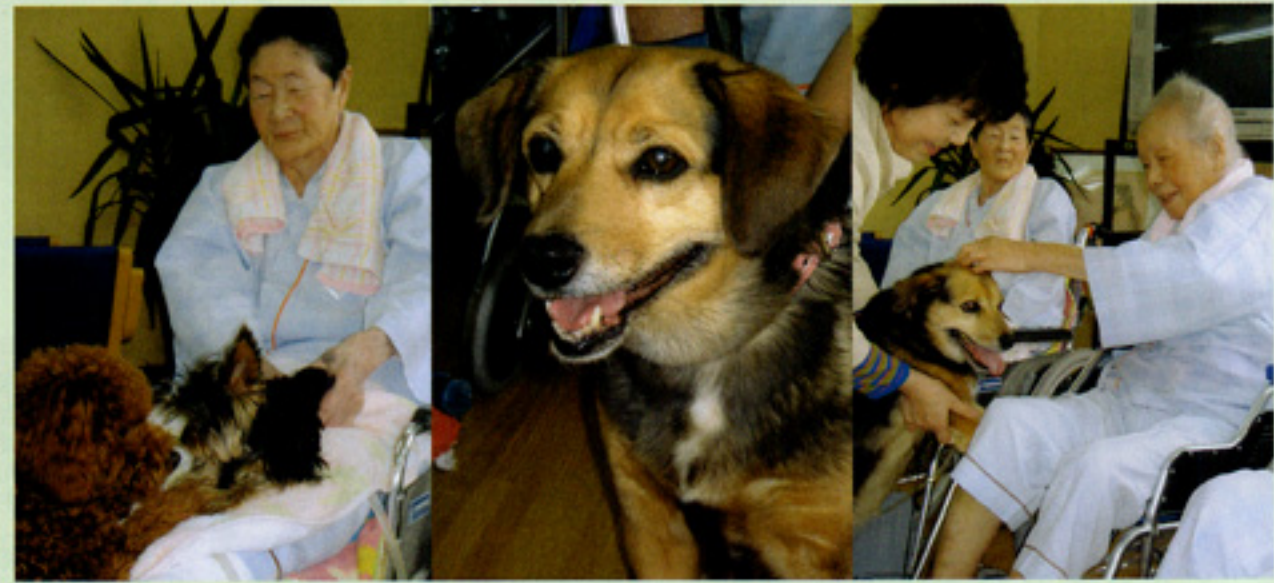
はじめてのころみ ～ワンちゃん3匹によるアニマルセラピー～ 5月17日(水)こすもす病棟の様子

6月末現在、新たに当院で常勤医師として勤務していただける医師は確定していません。 しかし、この間に多くの町民の皆様はじめ、当町と関係のある皆様からは、心強いご支援をたくさんお寄せいただいています。深く御礼を申し上げます。 皆様のご支援の結果、5月、6月には4名の医師に町内と病院を見学していただきました。 4名の医師は一樣に病院の建物が古いという感想を述べていましたが、幸いなことに信濃町には好印象を持っていただきました。現