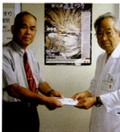
▲野尻湖夏まつりにあわせ職員有志で寄付をいたしました。

毎月第1第3水曜日の朝7時30分~8時まで職員で病院のまわりの草とり、ゴミ拾いを実施しています。