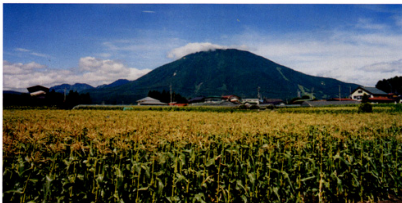
一面に広がるもろこし畑