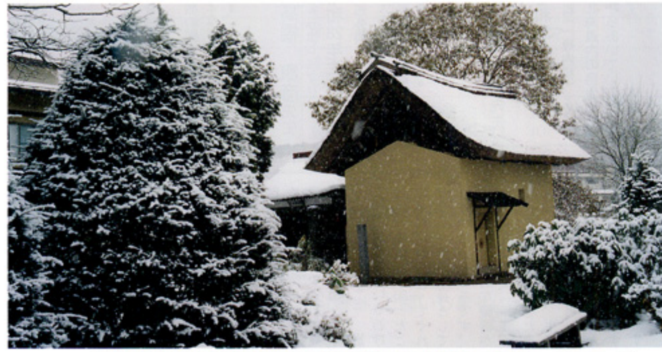
200年余の歴史を経て静かにたたずむ小林一茶旧宅